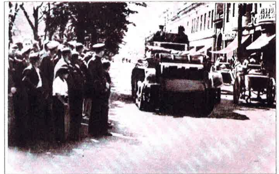
Okupacinė kariuomenė įžengia į Kauną. 1940 m. birželio 15 d.

Baltijos šalių 1940 metų patyrimas yra rimta pamoka. Atsižvelgiant į tai, Rusijos veiksmai Ukrainoje 2014 metais – tai rimtas ir pavojingas tarptautinės teisės pažeidimas. Rusija, aneksuodama Krymą, telkdama kariuomenę prie Ukrainos sienų, pakenkė ne tik Ukrainai, bet ir tarptautinių susitarimų sistemai. Europos Parlamentas pažymėjo, kad „Rusijos tvirtinimas, kad ji turi teisę naudoti visas priemones siekdama apsaugoti rusų mažumas trečiojoje šalyje (...) neatitinka tarptautinės teisės nuostatų ir pažeidžia pagrindinius tarptautinės elgsenos XXI a. principus, taip pat kelia grėsmę pokarinei tvarkai Europoje. Pasak Kolumbijos universiteto ekonomikos profesoriaus Jeffrey D. Sachso, jeigu Rusija nepakeis savo politikos, turėtume sulaukti itin rimtų pasaulinių padarinių, tarptautiniai santykiai taps dar labiau įtempti ir persmelkti nacionalizmu. Klaida iš vienos ar kitos pusės gali privesti prie tragiško karo. Žvilgtelėję į praėjusius šimtą metų iki Pirmojo pasaulinio karo pradžios, visada rasime įrodymų, kad vienintelis būdas užtikrinti saugumą pasaulyje yra tarptautinė teisė, kurią palaiko Jungtinės Tautos ir kurią gerbia visos šalys.