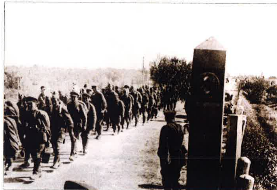
Raudonosios armijos kariai kerta SSRS-Lietuvos sieną. 1940 m. birželio 15 d.