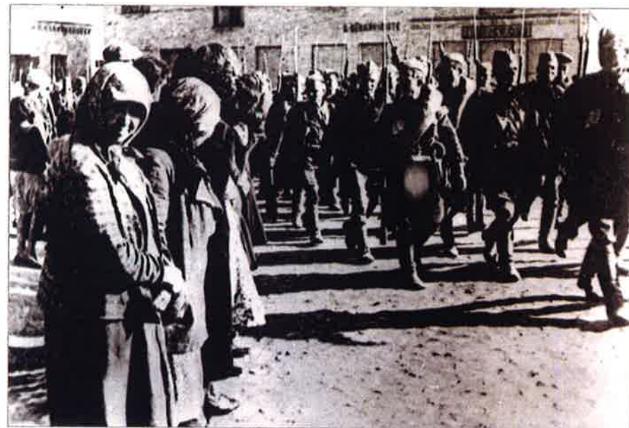
Raudonosios armijos daliniai žygiuoja per Eišiškes. 1940 m. birželio 15 d.