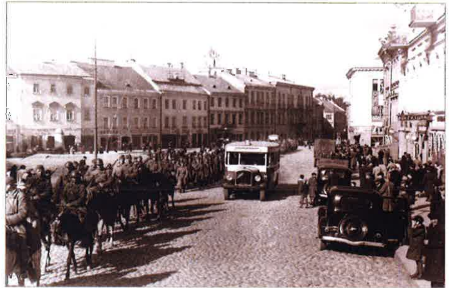
Raudonosios armijos karių kolona Vilniuje. 1939 m. rugsėjo mėn.

visos jos gerokai išgąsdintos. 1939 m. rugsėjo mėn. pabaigoje Baltijos šalių pasienyje Sovietų Sąjungos buvo sutelkta 437 235 kariai, 3 052 tankai ir 3 635 artilerijos pabūklai.