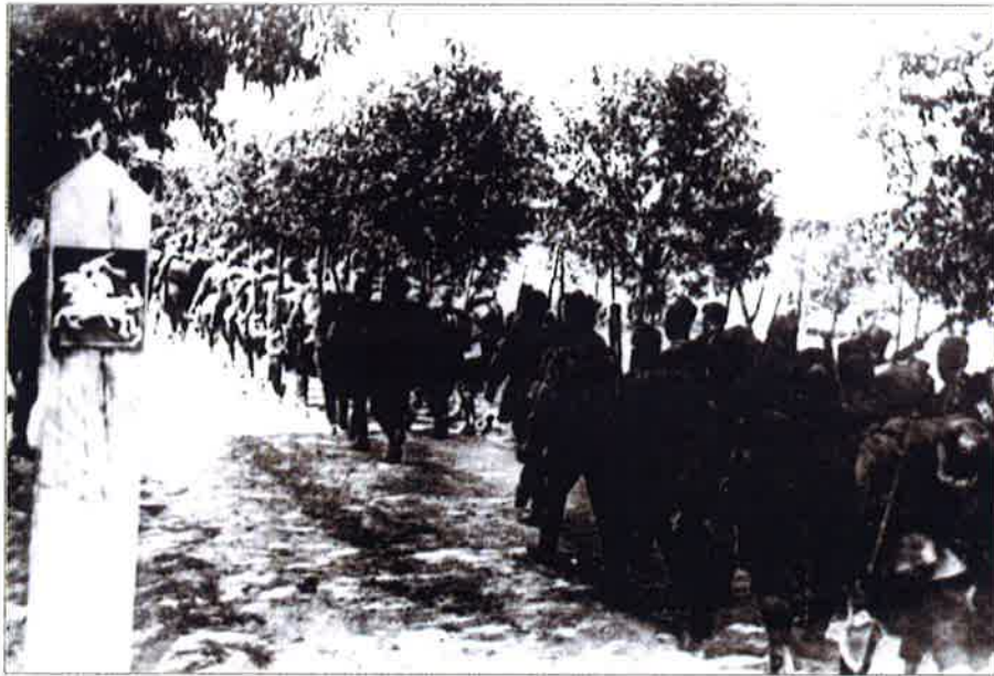
Raudonosios armijos kariai kerta SSRS-Lietuvos sieną. 1940 m. birželio 15 d.

Kremliaus tuometinės ekspansinės politikos gairės aiškiai atskleistos Raudonosios armijos politinės valdybos direktyvoje Nr. 5258ss: „Mūsų užduotis aiški. Mes norime užtikrinti SSRS saugumą, stipriu užraktu uždaryti iš jūros priėjimus prie Leningrado, mūsų šiaurės–rytų sienas. Per Estijos, Latvijos ir Lietuvos antiliaudiškų klikų galvas mes įvykdysime mūsų istorinius uždavinius ir kartu padėsime šių šalių darbo liaudžiai išsivaduoti. (...) Lietuva, Estija ir Latvija taps sovietiniu forpostu ant mūsų jūrų ir sausumos sienų. Pasiruošimas puolimui turi būti visiškoje paslapyje. (...) Reikės greitai saudyti priešą armiją, demoralizuoti užnugarį ir tokiu būdu padėti Raudonosios armijos vadovybei per trumpiausią laiką ir su mažiausiomis aukomis pasiekti visiškos pergalės“.